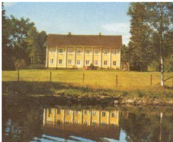
Schedingsnäs herrgård spglar sig i Källundasjön.