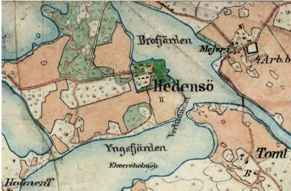
Hedensö gods i Österrekarne hd, Södermanland

- från Stjärnbjälke genom Fargalt, Krumme och Gylta till Kurck