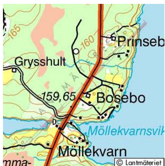
Möllekvarn, Bosebo och Grysshult vid Bolmens sv del.