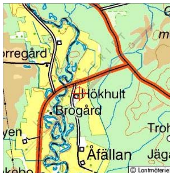
Släkten Hök utgick från rusthållet Hökhult i Kärda socken norr om Forsheda.