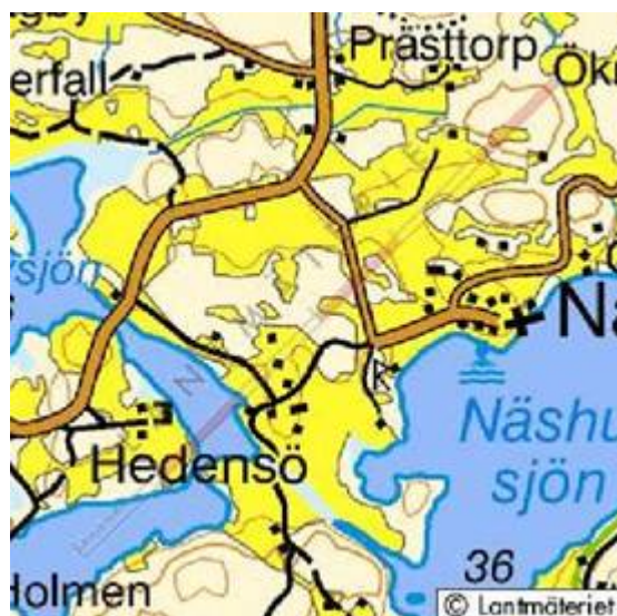
Hedensö i Näshulta