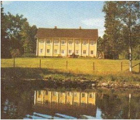
Schedingsnäs vid Källundasjön