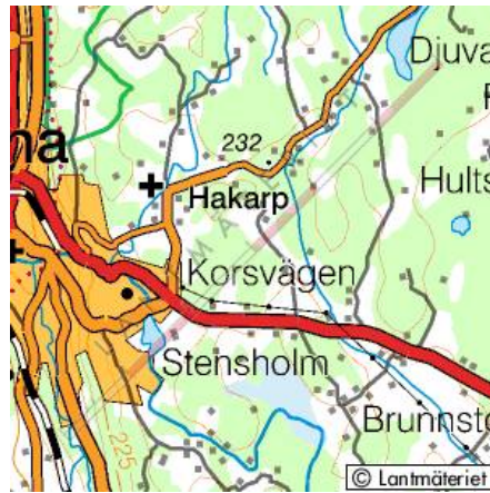
Stensholm med Smedstorp och Brunseryd vid Huskvarnaån.