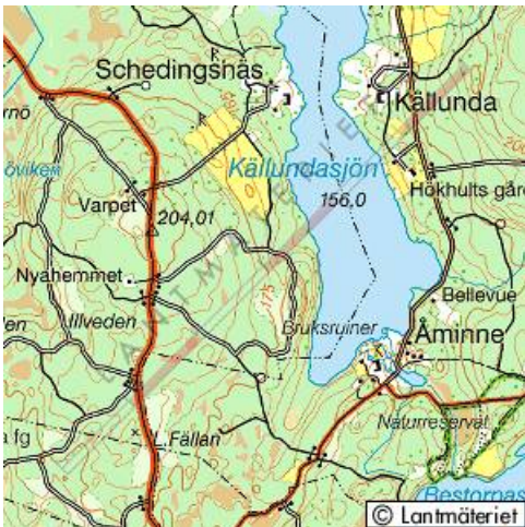
Schedingsnäs säteri vid Källundasjön