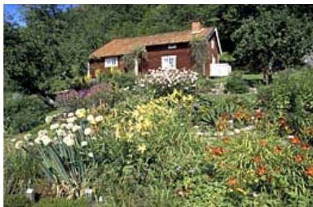
Brunseryd i Malmbäck