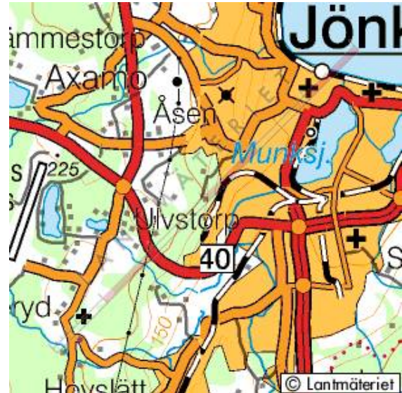
Åsens gård vid den gamla utfarten från Jönköping (Åsensvägen) är idag omgivet av bebyggelse, vägar och ett flygfält.