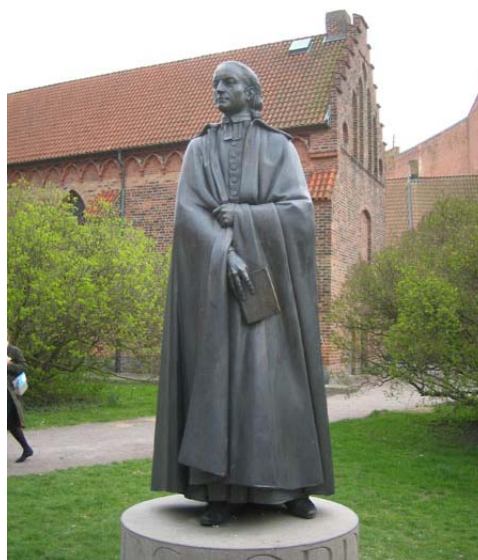
Prosten Henrik Schartau