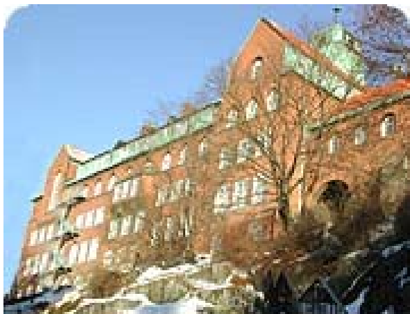
Schartaus handelsinstitut, Stockholm