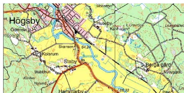
Berga gård i Högsby