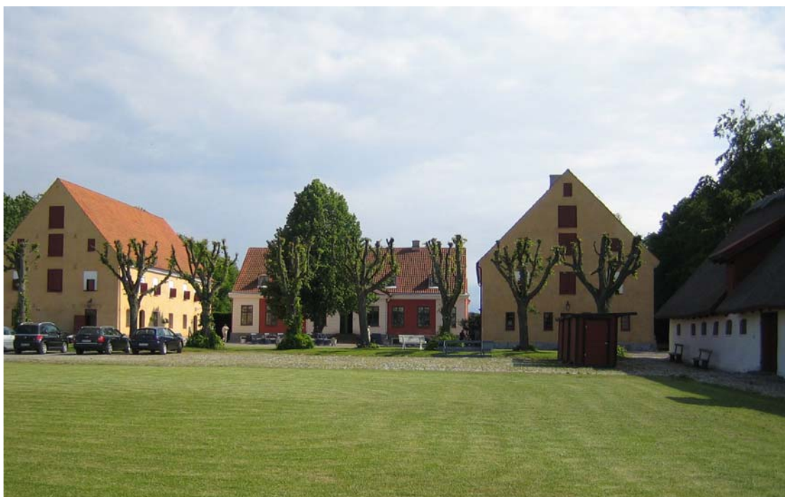
Katrinetorps gård i Malmö – strax nordost om Petersborgs trafikplats