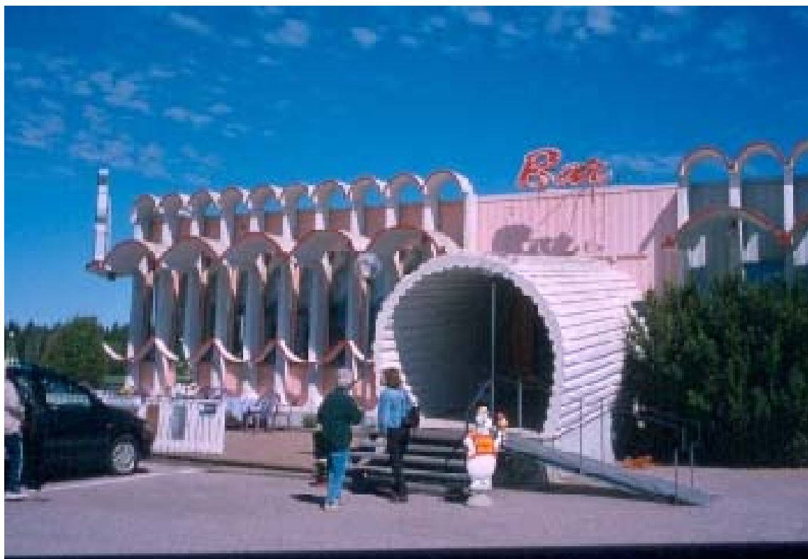
Brännebrona motell vid E20 har en extremt modern exteriör.