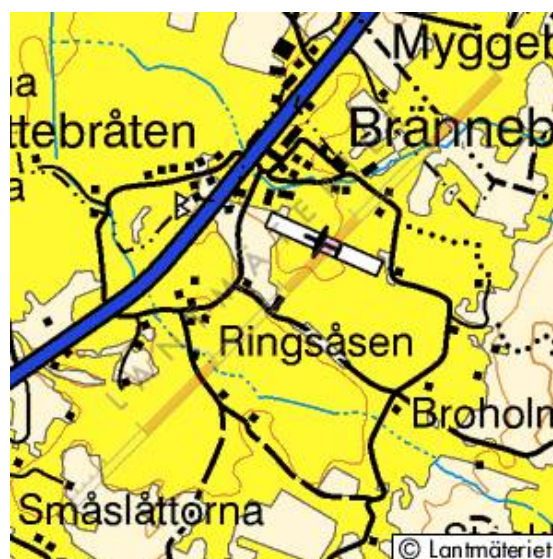
Brännebrona och Ringsåsen i Holmestad..