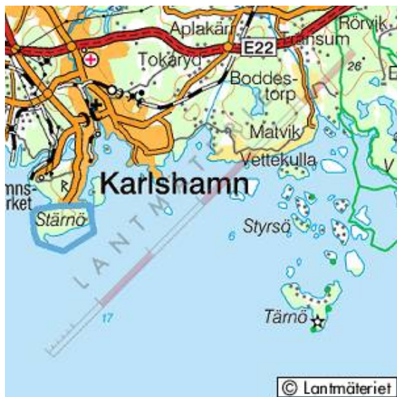
Tärnö är en av de många öarna i Karlshamns skärgård.

Tärnö är en liten ö i Karlshamns skärgård med lots- och fyrplats samt fiskeläge. Ön tillhör Hällaryds socken och dess historia är känd sedan den danska tiden med en väl dokumenterad tomtindelning och en i stort känd ägarlängd. Den förste kände brukaren var festebonden Tyge Lauritsen omkring 1600. En festebonde hade livstidsarrende med arvsrätt.