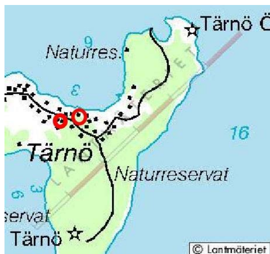
Del av Tärnö. Ringarna markerar det ungefärliga lägena av Lines (t v) och Tyras (t h) stugor.