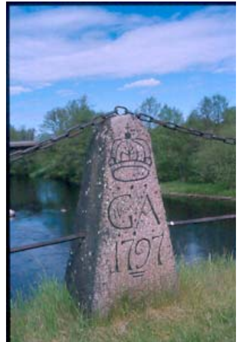
Dagens "gamla" Öjebro byggdes på Gustaf IV Adolfs tid.

Där korsades ån av två vägar, dels huvudvägen från Linköping till Skänninge och Vadstena, dels en nord-sydlig väg från Småland upp mot slätten. I ån fanns en ö, som underlättades brobygget.