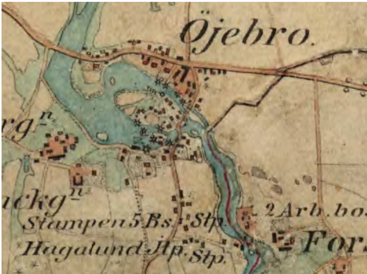
Öjebro. Den bro som gett platsen dess namn, är sannolikt inte huvudvägens k-märkta bro i övre vänstra hörnet, utan de dubbla broarna vid fallen i kartans mitt.