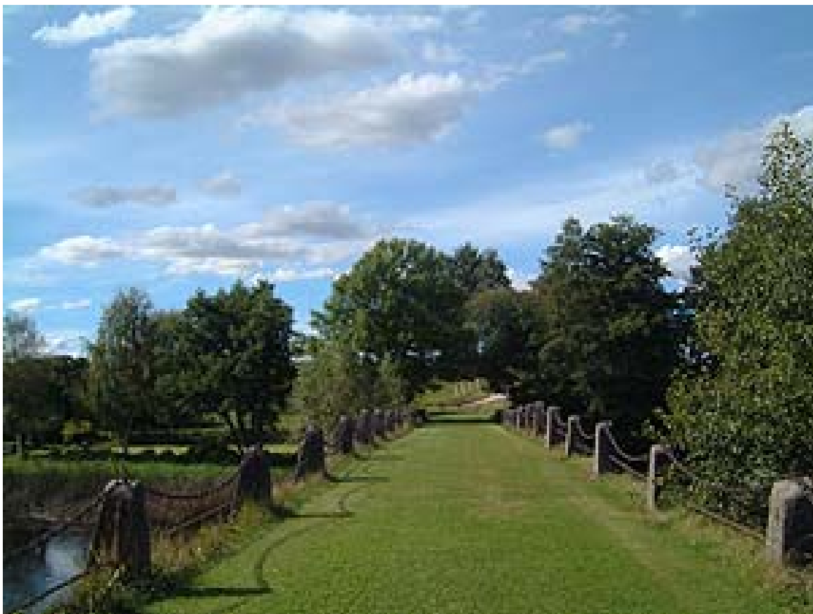
1797 års bro är nu gräsbeväxt – Foto 2002

Dagens karta visar ett kraftverk på den gamla kvarnens plats.