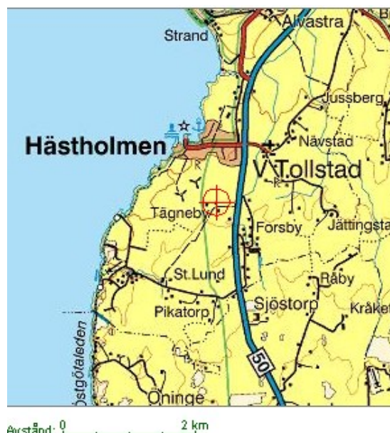
Tegneby ligger i V Tollstad mellan Öninge och Alvastra.. På kartan syns även Ellen Keys Strand.