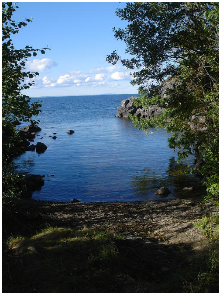
Vättern nedanför Öninge

Släkten Henriksson hade sina farsanor i Gatugården och morsanorna i Brodderyd och Öninge.