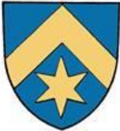
"sparre över stjärna"