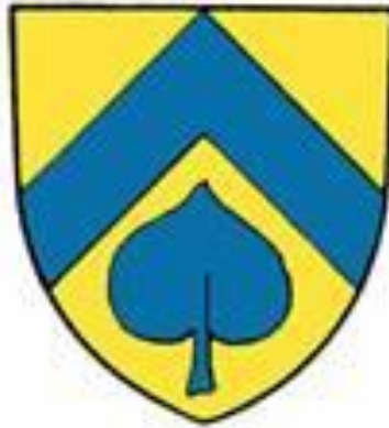
"sparre över blad"