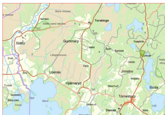
Fylleryd i Torskinge socken