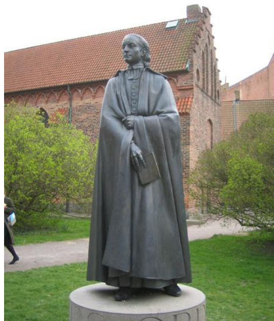
Prosten Henrik Schartau