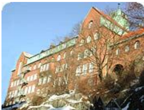
Schartaus handelsinstitut, Stockholm