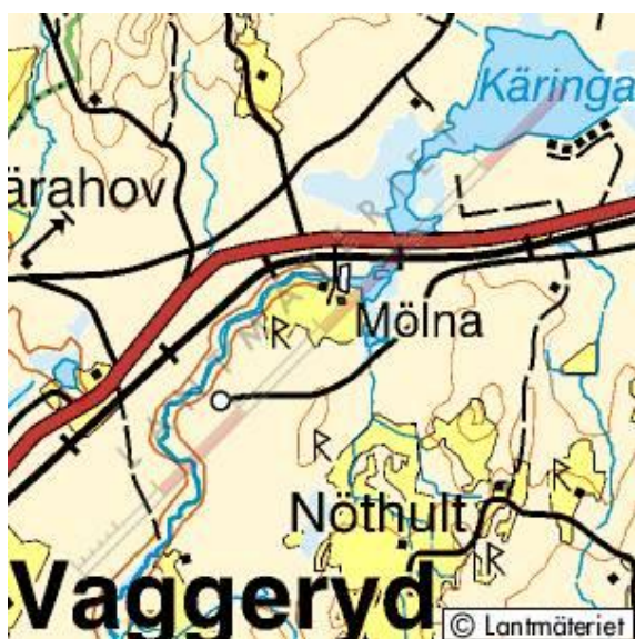
Mölna i Byarums socken, ett arv från svärmmodern i andra giftet.