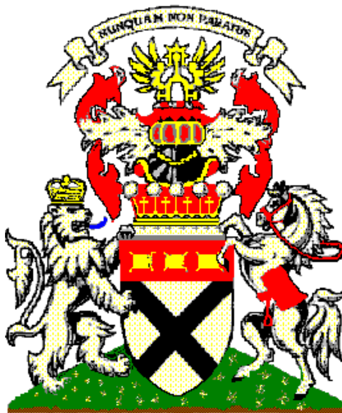
Ätten Johnstones vapen