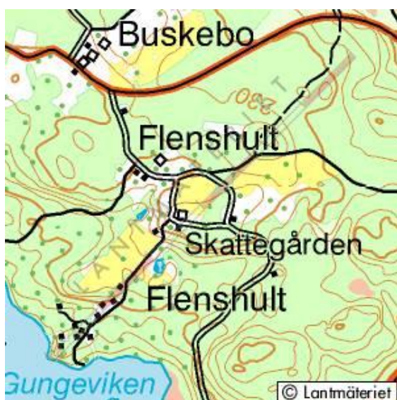
Flenshult i Kalstorp