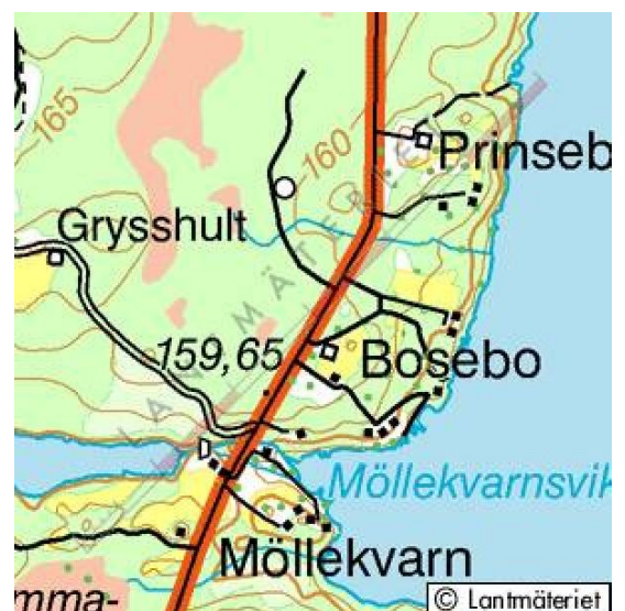
Möllekvärn, Bosebo och Grysshult vid Bolmens sv del.