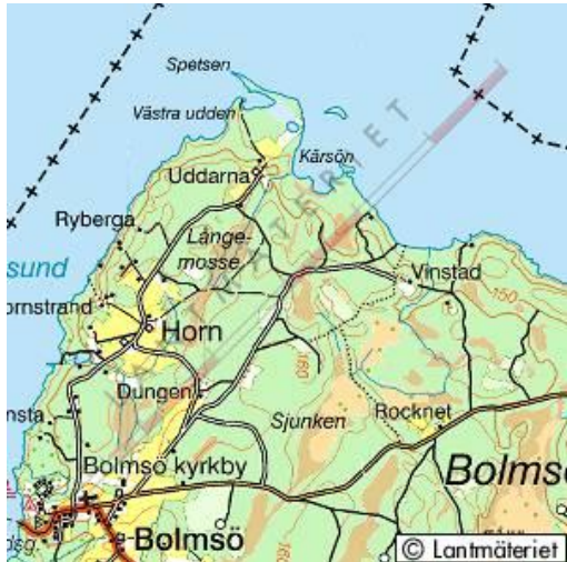
Norra delen av Bolmsön med Horn och Vinstad .