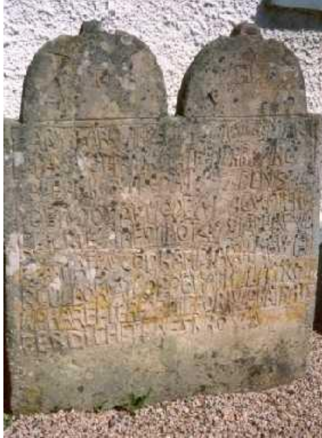
Carl Eneroths gravsten vid Torskinge kyrka

HÄR WILAR CARL:ERICK:SON OCH:MÄRT A:PÄRS:DOT:FRÅN:SLÄTTÖ:NORR:GÅRD CAL:ERICKSON::1697:DEN:5:OC TOBER:DÖDA:1770 DEN 19 AGUSTII:FIC K LIGRTEXT AF 2 TIMOT 4 78 IAG HAFWE R KAMPAT EN GOD KAMP IAG HAFWE R FULBORDAT LOPPET IAG HLLIT TRO NA HAREFTER AR MIG FÖRWARAT RAT FERDIGHETENES KRONA