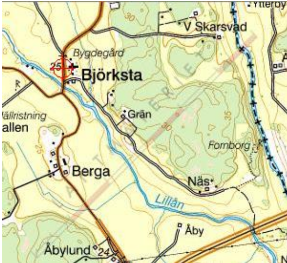
Björksta k:a och Berga gård nära länsgränsen mot Uppsala län.