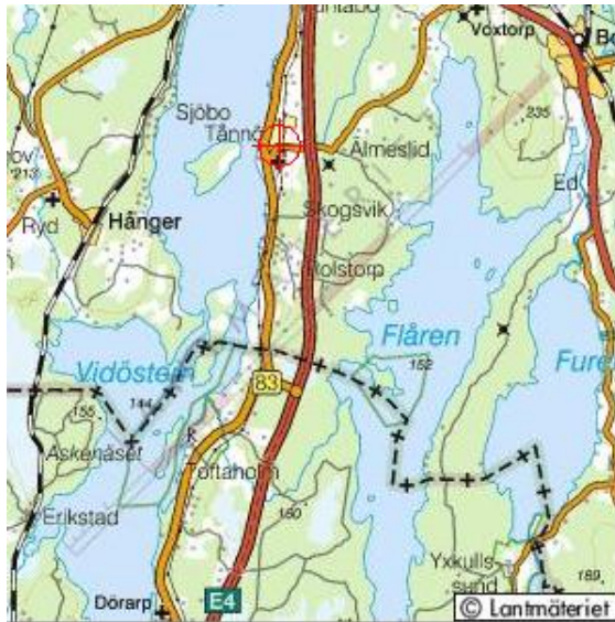
Tännö mellan Vidöstern och Flåren.

Östbo hd är en del av Finnveden, en historiskt intressant trakt. Söder om länsgränsen mot Kronoberg ligger på ömse sidor om Vidöstern Stenbockarnas stamgods Erikstad i Vittayd och Toftaholm i Dörarp. Öster om Flåren ligger Trolleättens Ed i Voxtorp, där deras fäste Trolleborg förstördes av Engelbrekts trupper 1434.