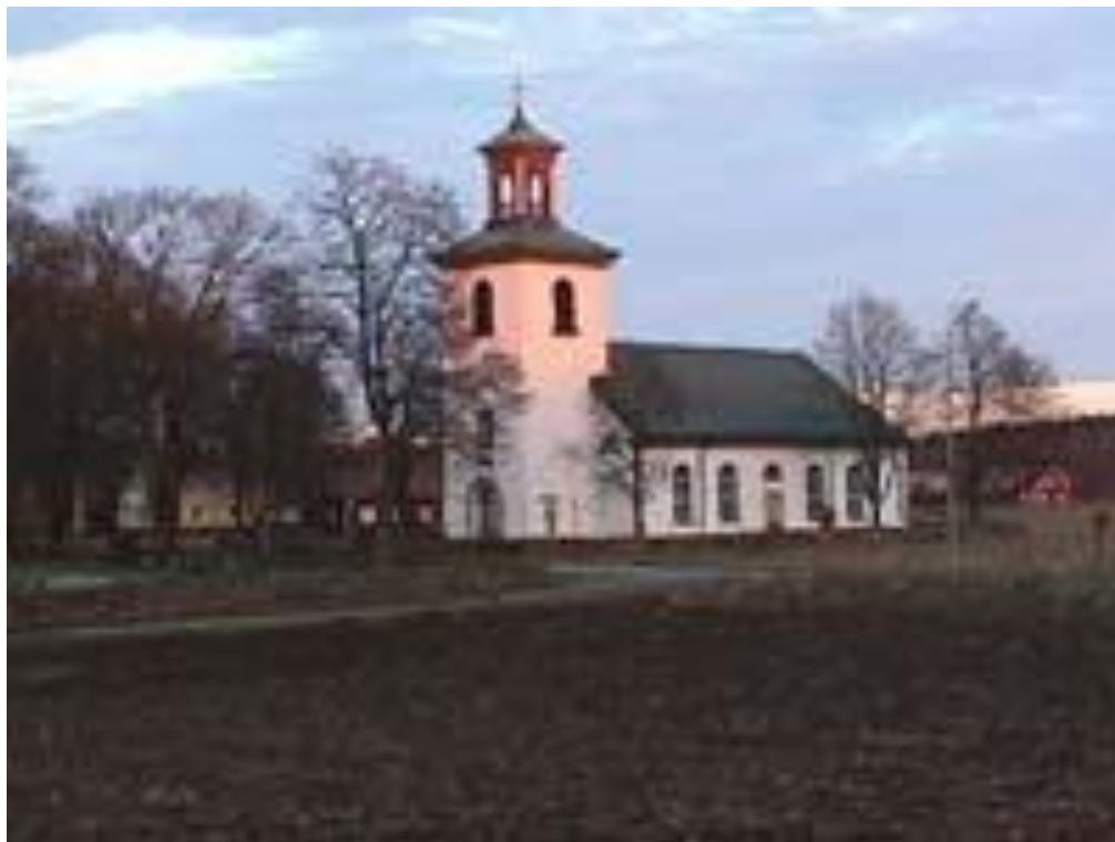
Tännö kyrka